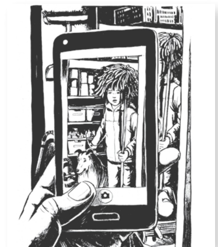
Illustrationen aus dem Buch